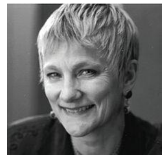
Anita Borg (1949 – 2003) a imaginé un système permettant d'analyser des systèmes mémoriels à haute vitesse