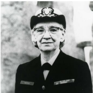
Grace Hopper (1906 – 1992) a conçu le premier langage de programmation