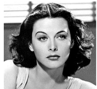
Hedy Lamarr (1914 – 2000) est considérée comme l'inventeuse du GPS