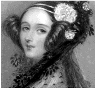
Ada Lovelace (1815 – 1852) a créé le 1 er programme informatique