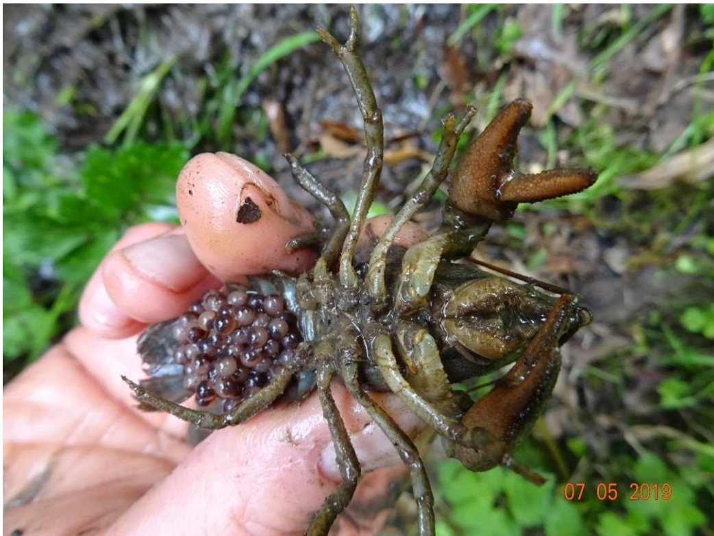
Femelle APP grainée, photo DDTM27