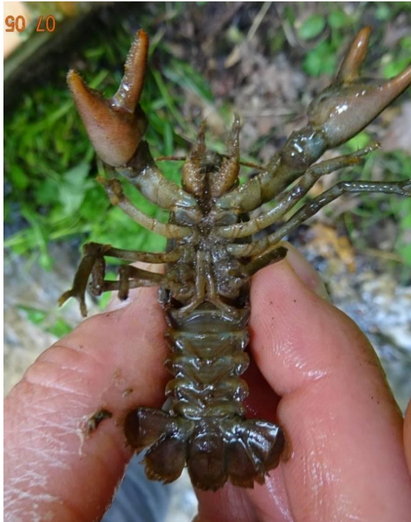
Face ventrale d'APP

La pêche de l'espèce étant interdite, il est recommandé d'être avec un agent assermenté qui se chargera des manipulations, en plus d'être apte à effectuer une identification précise.