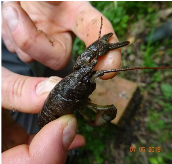
Face dorsale d'un mâle APP