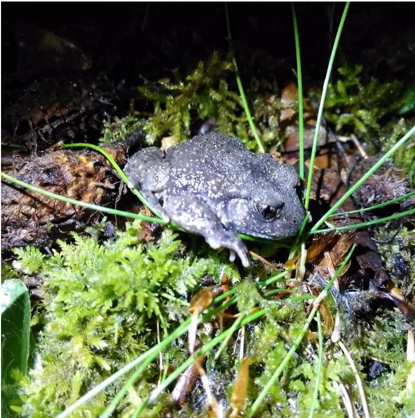
Alyte accoucheur

Ses signes distinctifs sont sa pupille ovale verticale et son iris doré. Sa peau est granuleuse avec quelques pustules, de couleur plutôt grise. Son chant est très reconnaissable.