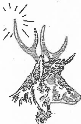
8 cors à surandouillers