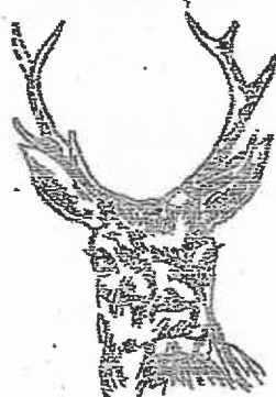
8 cors à petites fourches (moins de 10 cm de longueur)