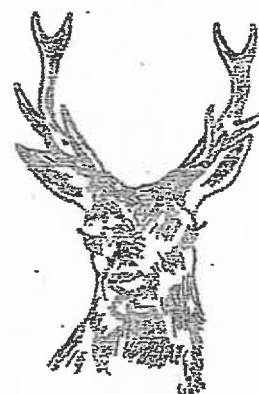
10 cors à petites fourches (moins de 10 cm de longueur)