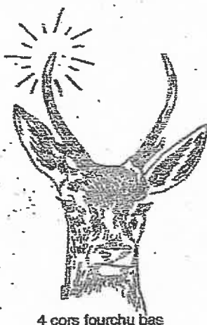
4 cors fourchu bas