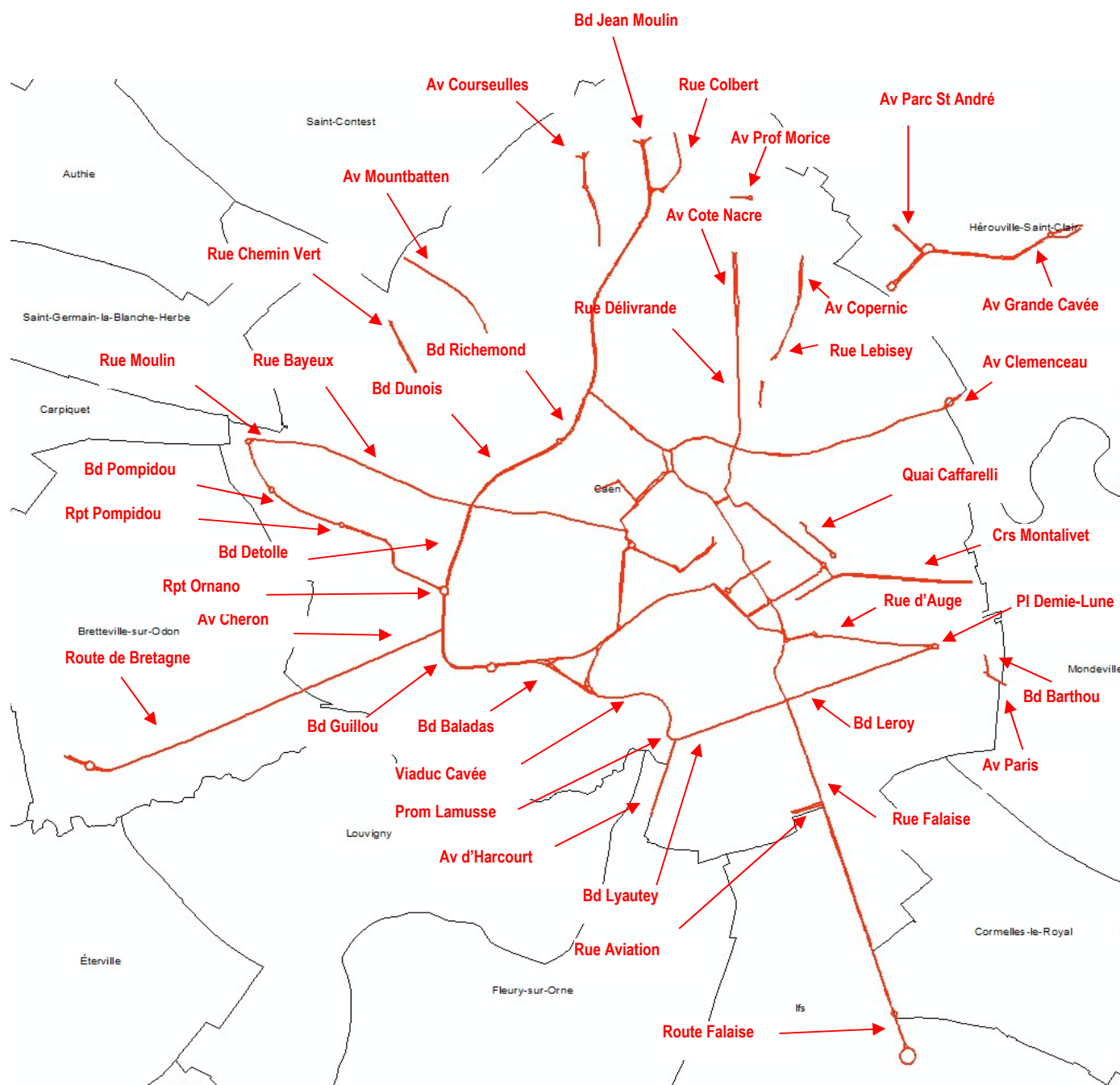
Repérage des voies communales étudiées sur Caen et les communes adjacentes dans le département du Calvados