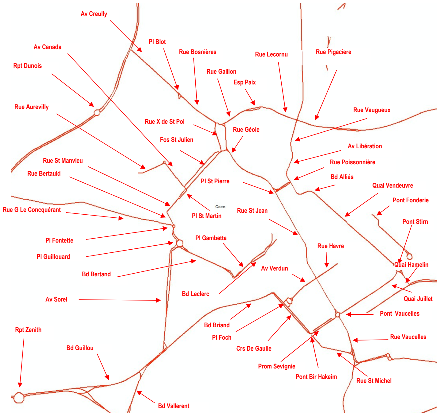
Repérage des voies communales étudiées au centre de Caen dans le département du Calvados