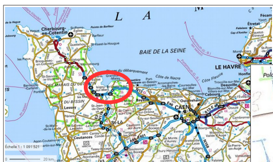
Localisation du site du projet de mise en place de la nouvelle tour de séchage