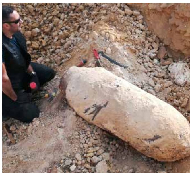
Bombe américaine de 1000 livres à Colombelles en 2020