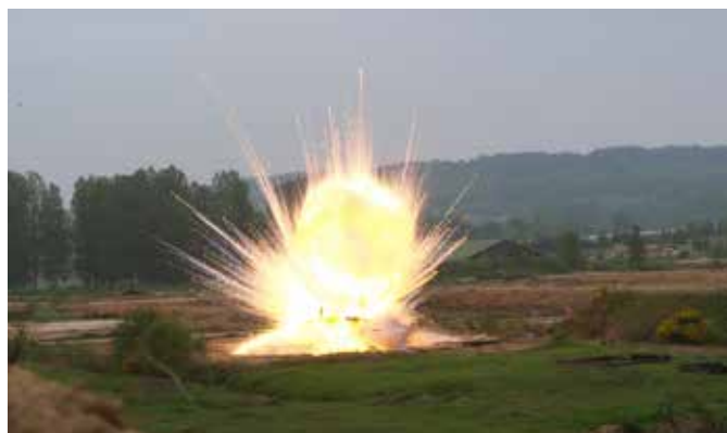
Destruction de roquettes anglaises anti-char