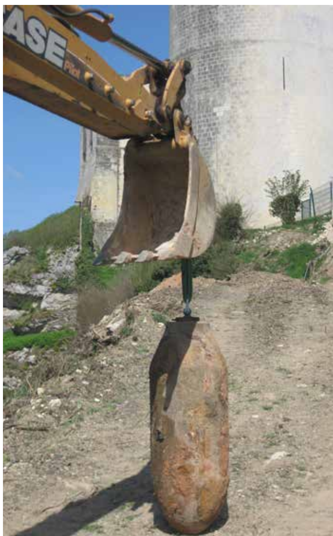
Bombe découverte à Falaise en 2012

UN ENGIN DE GUERRE, MÊME DÉTÉRIORÉ, PEUT TOUJOURS SE RÉVÉLER DANGEREUX.