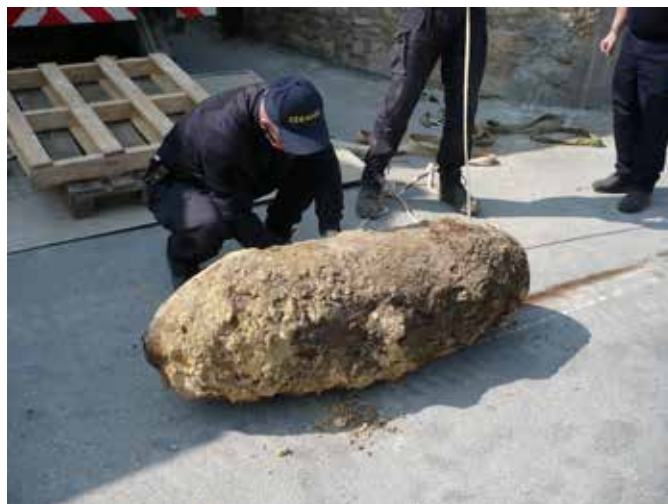
Bombe anglaise de 1000 livres à Fleury-sur-Orne en 2011

Aujourd'hui, le Calvados porte encore les traces de ce conflit et les découvertes de munitions de guerre, souvent encore actives, sont fréquentes.