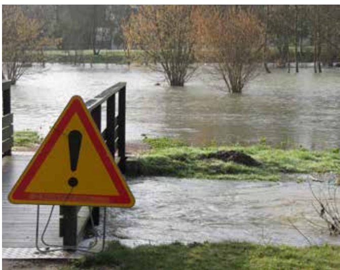
Crue de l'Odon à Verson en 2010