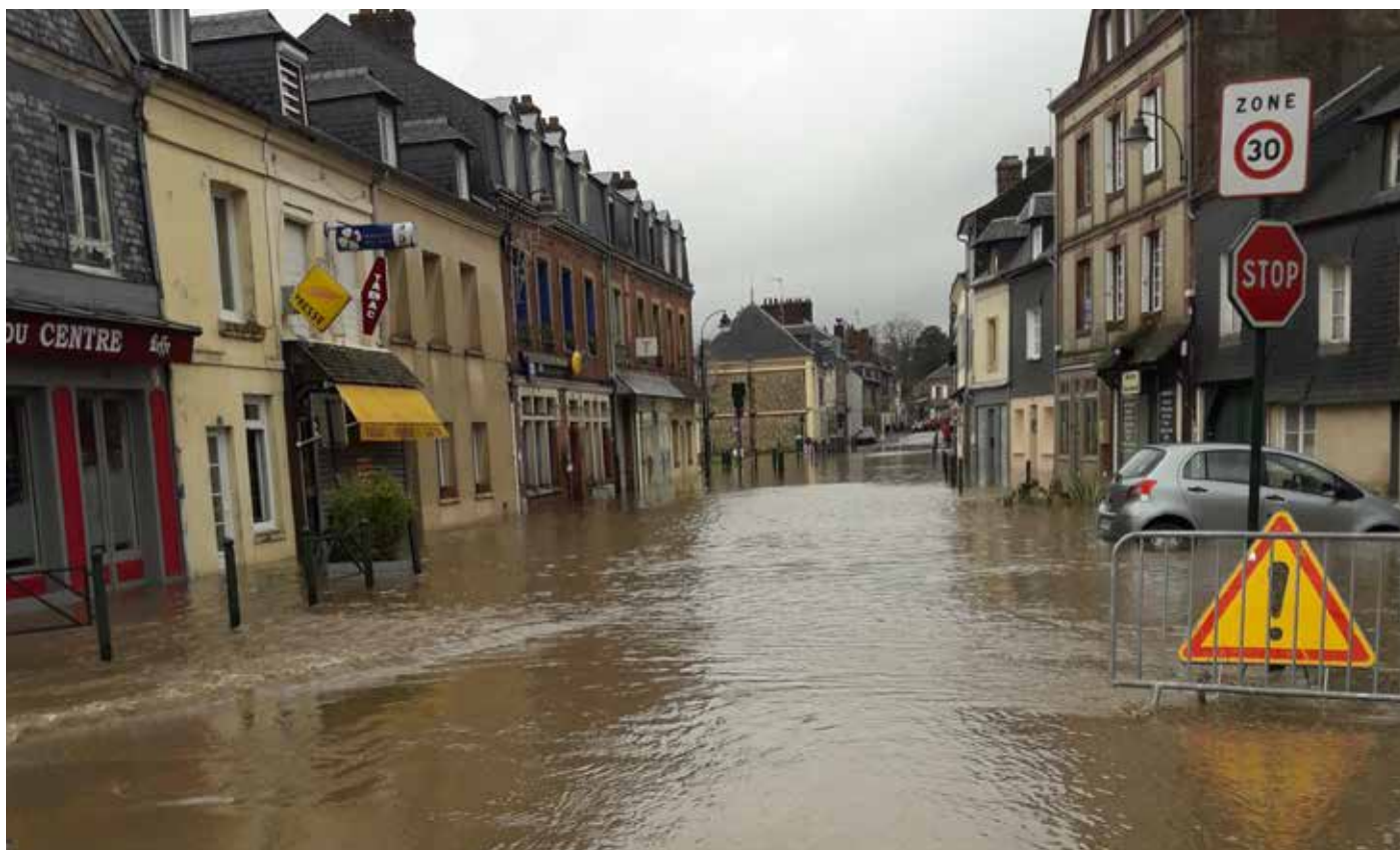
Inondation sur la commune de la Rivière Saint-Sauveur

la commission ne statuera définitivement qu'après examen d'informations complémentaires.