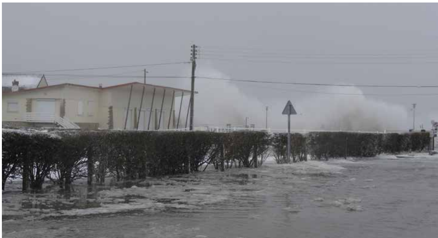
Ver-sur-Mer en 2013

* : Référence 2011 de tarif de franchise susceptible d'évoluer au fil des années.