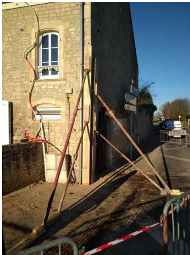
Conséquences d'un mouvement de terrain

En cas d'intensité anormale de l'agent naturel et pour les biens couverts par un contrat d'assurance "dommages aux biens".