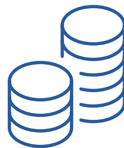
Répartition des dossiers par mesure